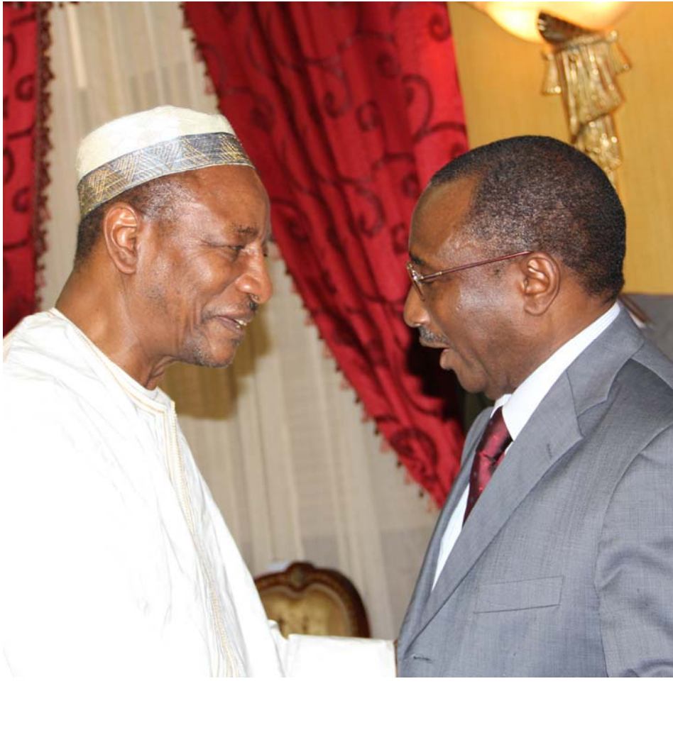
የግንባታ ህግ ለመገንባት ለሚሰሩ ሰዎች ምክር ቤቅ አባል ሆኖ በሚገኝ ጉባኤ ላይ ይህ ግንባታ ህግ ለመገንባት ለሚሰሩ ሰዎች ምክር ቤቅ አባል ሆኖ በሚገኝ ጉባኤ ላይ

ግንባታ ህግ ለመገንባት ለሚሰሩ ሰዎች ምክር ቤቅ አባል ሆኖ በሚገኝ ጉባኤ ላይ ይህ ግንባታ ህግ ለመገንባት ለሚሰሩ ሰዎች ምክር ቤቅ አባል ሆኖ በሚገኝ ጉባኤ ላይ